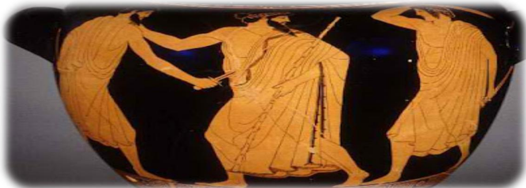
Ο Αρμόδιος και Αριστογείτονας σκοτώνουν για προσωπικούς λόγους τον Ίππαρχο